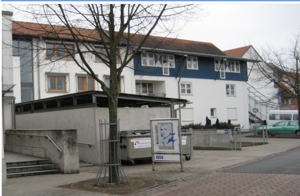
Pflegezentrum Astor-Stift, Alte Friedhofstraße

Mit dem Bau der Seniorenwohnanlage „Astor-Stift“, die im Juni 1988 eingeweiht wurde, der Inbetriebnahme des Pflegezentrums Astor-Stift im Dezember 1998 und der Seniorenwohnanlage Hopp-Stift (jetzt „Hopp-Stift I“) im Februar des Jahres 1999, wurde die Stiftung im Vergleich zu den Vorjahren wieder „mit Leben“ gefüllt.