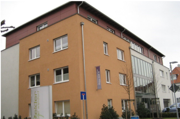
Ansicht der Seniorenwohnanlage Hopp-Stift II, Bahnhofstraße