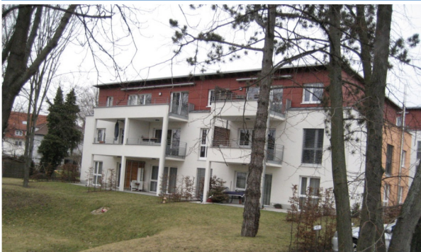
Rückansicht Hopp-Stift II

Der 1. Spatenstich erfolgte am 14.04.2008; die Einweihung fand im Oktober 2009 statt. Die Seniorenwohnanlage wurde nach ihrer Realisierung im Wege eines Schenkungsversprechens an die Astor-Stiftung übergeben.